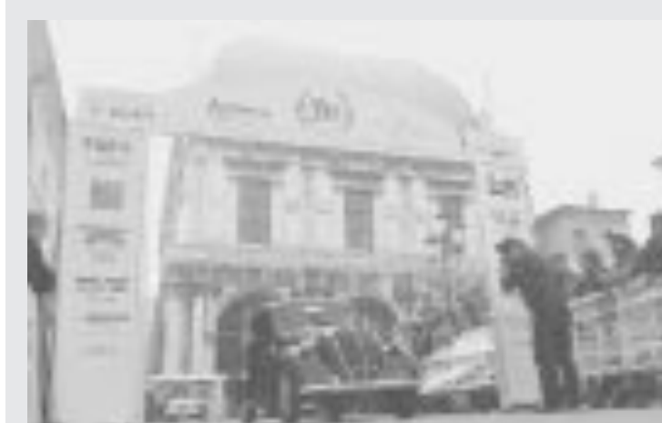
AUTO E MOTO D'EPOCA. Per la 500 Miglia Touring, una carovana di auto e moto d'epoca partirà questo pomeriggio da Piazza Loggia alle 16 e per tre giorni girerà in Lombardia. Il ritorno è previsto per domenica pomeriggio dopo aver passato Iseo, Lumezzane ed il Garda.