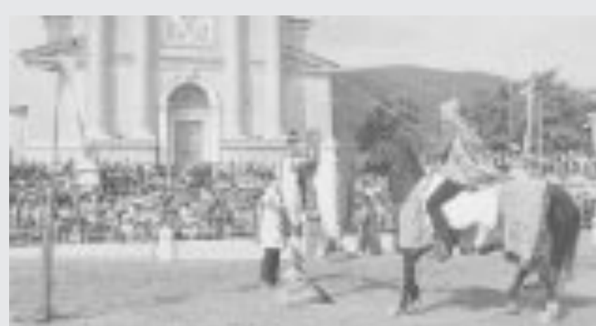
GIOSTRA MEDIOEVALE Domenica è in programma la Giostra di Pontevico, manifestazione che rievoca duelli medievali e antichi giochi in costume

Se arriva il sole prima uscita per auto e moto d'epoca, ma se il maltempo dovesse proseguire terranno banco le mostre di Brescia, Montichiari e Travagliato