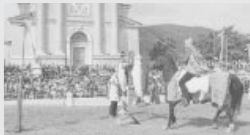
GIOSTRA MEDIOEVALE Domenica è in programma la Giostra di Pontevico, manifestazione che rievoca duelli medievali e antichi giochi in costume che vedrà in gara i comuni della zona Apertura alle 11, in piazza Mazzini, col calcio storico. Alle 15.30 avrà inizio il torneo equestre.

Se arriva il sole prima uscita per auto e moto d'epoca, ma se il maltempo dovesse proseguire terranno banco le mostre di Brescia, Montichiari e Travagliato