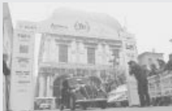
AUTO E MOTO D'EPOCA. Per la 500 Miglia Touring, una carovana di auto e moto d'epoca partirà questo pomeriggio da Piazza Loggia alle 16 e per tre giorni girerà in Lombardia. Il ritorno è previsto per domenica pomeriggio dopo aver passato Iseo, Lumezzane ed il Garda.