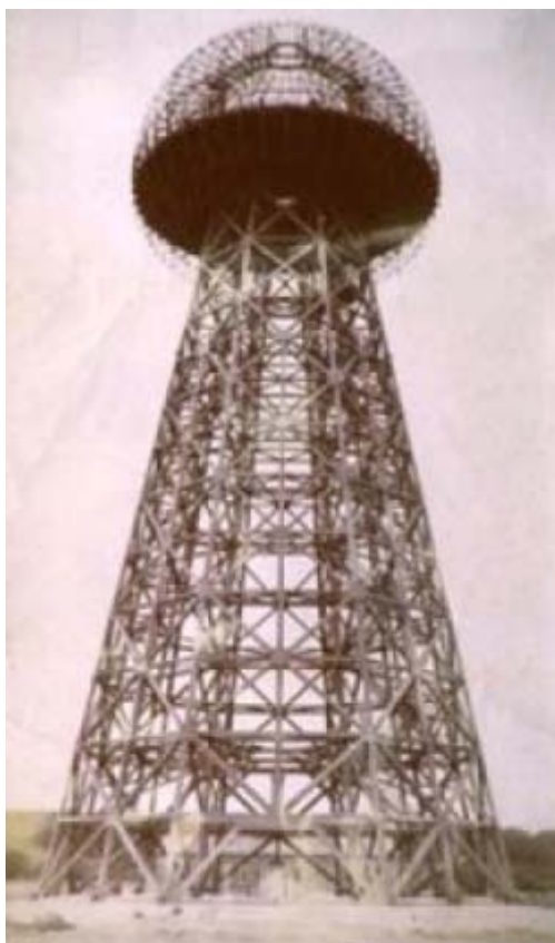
foto di una realizzazione basata sulle idee di Tesla